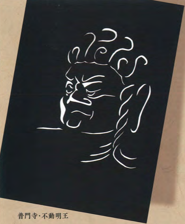
普門寺・不動明王