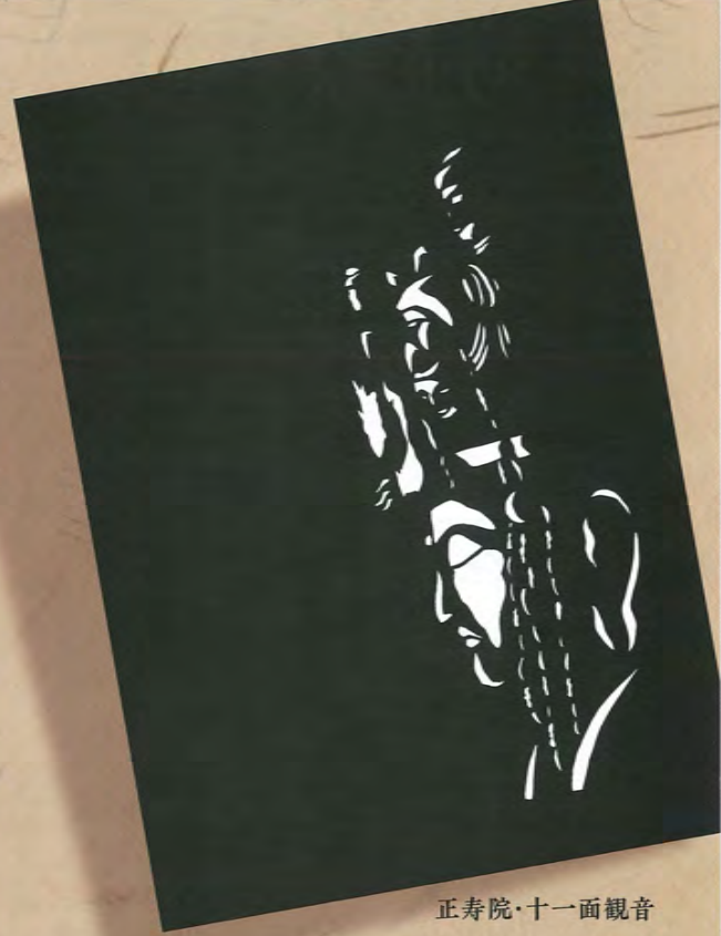
正寿院・十一面観音