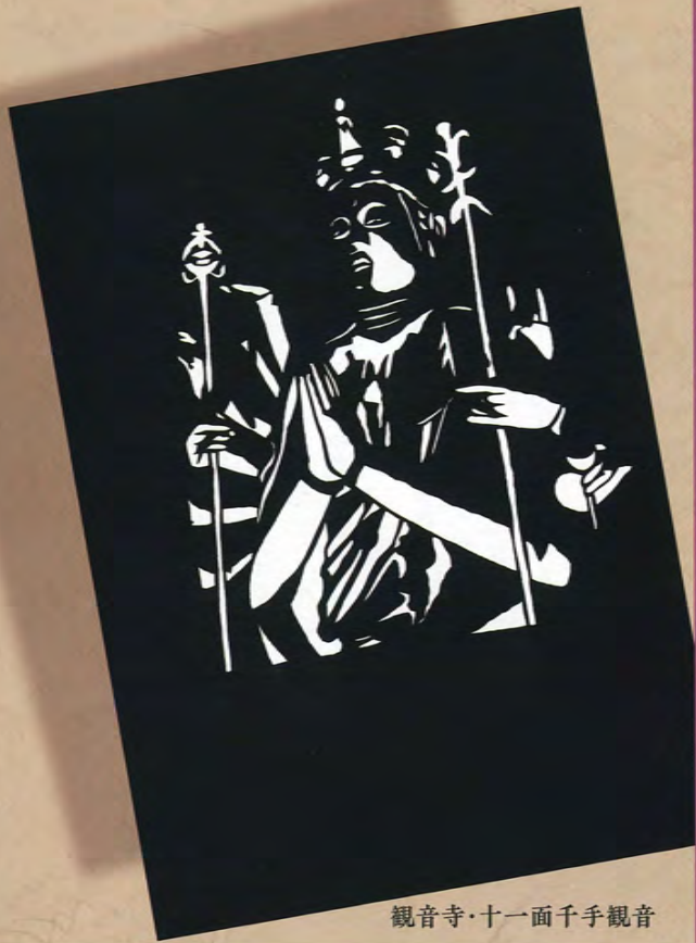
観音寺・十一面千手観音